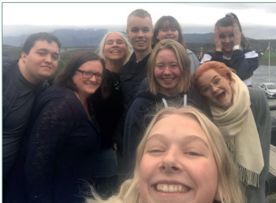
Helgesamling i Saltstraumen 15-17/9-17

Ungdomsrådet er presentert i styret, utvidet ledergruppe og AMU.